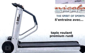
tapis roulant premium run8