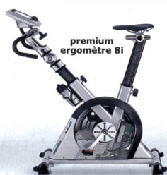
premium ergomètre 8i