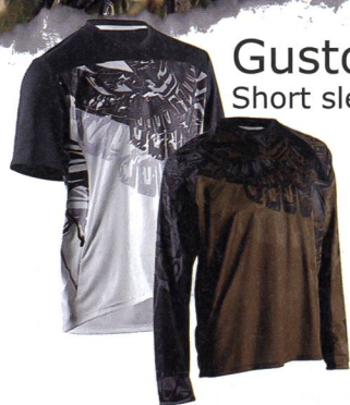
Gustov S/S Short sleeve