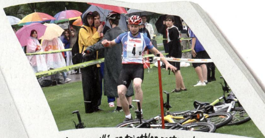
Même mouillé, un triathlon reste un bon triathlon.