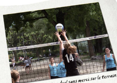
Les élèves se livrent un duel sans merci sur le terrain de beachvolley.

manifestations de ce genre ont une grande valeur éducative. Les élèves se rencontrent, rivalisent avec d'autres et ont ainsi la possibilité de vivre des moments en commun aussi bien durant les activités sportives que les loisirs.»