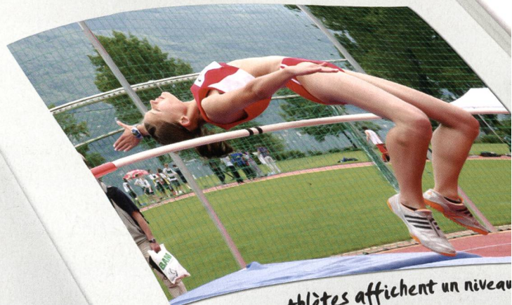
Certaines athlètes affichent un niveau