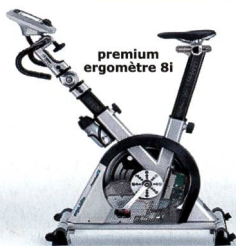
premium ergomètre 8i