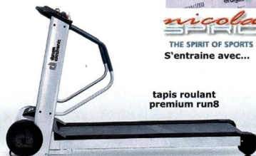
tapis roulant premium run8