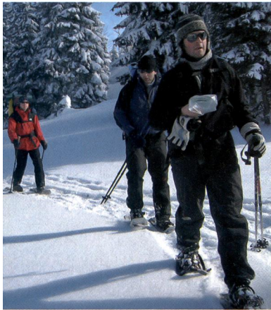
Les sorties à raquettes connaissent un boom. Au grand dam, parfois, des petits animaux effrayés par ces nouveaux visiteurs.