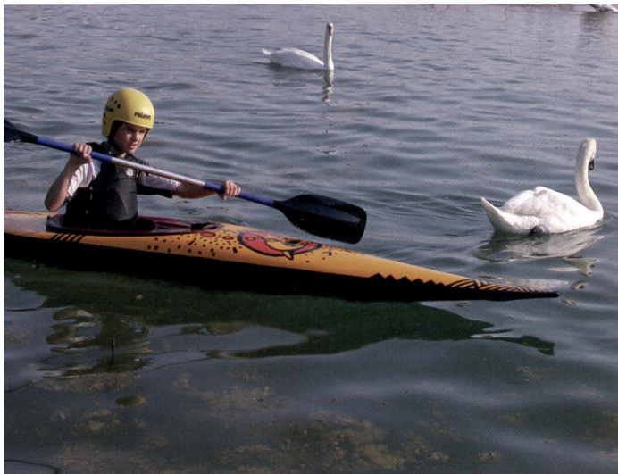
Au gré de l'eau, les images défilent plus lentement.