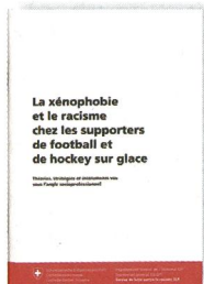
Zimmermann, D. (2005). La xénophobie et le racisme chez les supporters de football et de hockey sur glace. Berne, Département fédéral de l'intérieur, 49 pages.

Pour des jeunes souffrant de troubles de la personnalité et du comportement, le défi est de taille: en effet, il ne s'agit pas seulement de cohabiter à bord, de faire la cuisine et de tenir la barre. Cet atelier voile interdisciplinaire inclut de l'enseignement sur l'eau et à terre, un encadrement psychologique avec des temps de réflexion autour des sorties, des ouvertures sur l'extérieur de l'institution (notamment des présentations aux parents et même une animation au salon du livre de Genève!). L'apport pédagogique fait la part belle à la connaissance de l'environnement, la lecture de carte, l'orientation à la boussole et propose de nombreuses expériences concrètes (relevé des températures de l'eau, observation de la faune et de la météo, etc.). Enfin, la réalisation d'un journal de bord permet aux enfants de verbaliser leurs aventures, de les inscrire dans le temps et de maîtriser le traitement de texte. Le lecteur accompagne ces six matelots en herbe dans leurs peurs, leurs mésaventures techniques, leurs blocages, leur refus parfois, mais surtout dans leurs progrès, leur bonheur, leur apprentissage de l'autonomie ou de la réussite. Marianne Chapuisat