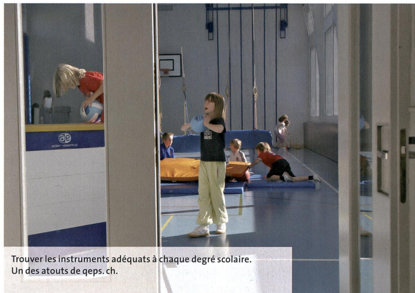
Trouver les instruments adéquats à chaque degré scolaire. Un des atouts de qeps.ch.

A propos de système, qeps.ch part d'un modèle qui conçoit l'école comme un tout. Il ne se limite pas à l'éducation physique, mais considère l'école dans sa globalité. Les maîtres d'éducation physique ne risquent-ils pas d'être débordés s'ils doivent assumer une part de responsabilité pour l'ensemble du système – l'école – et pas seulement pour leur branche? La réflexion sur la qualité est un problème qui se pose de façon générale. L'analyse de la qualité est étroitement liée aux processus de fabrication industriels. Prenons l'exemple classique du contrôle de la qualité dans la production de