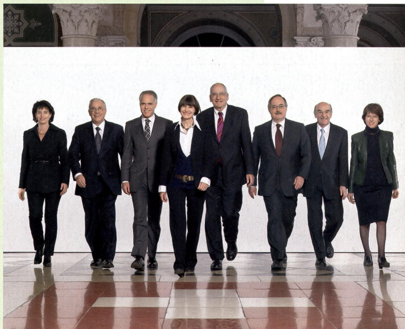
Le conseil fédéral part d'un bon pied dans la nouvelle année. Une invitation à leur emboîter le pas? C'est en tout cas la première photo qui montre nos conseillers en mouvement!