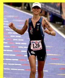
Karin Thürig: Championne Olympique

A l'aide de cet entraînement je peux utiliser efficacement l'entier de mon potentiel.