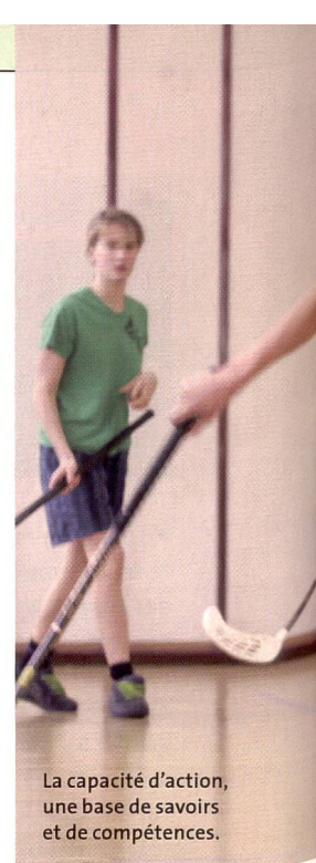
La capacité d'action, une base de savoirs et de compétences.

► Le Canton de Neuchâtel abrite trois grands établissements d'enseignement professionnel répartis à Neuchâtel, Colombier, La Chaux-de-Fonds et au Locle. Compte tenu de cette dispersion géographique, son Service de la formation professionnelle a opté pour un programme cadre cantonal d'éducation physique. L'objectif: fixer un socle de compétences et d'habiletés à acquérir. Ce document n'empêche pas les établissements de développer ou de privilégier certains sports, en fonction de leur environnement et de leurs infrastructures.