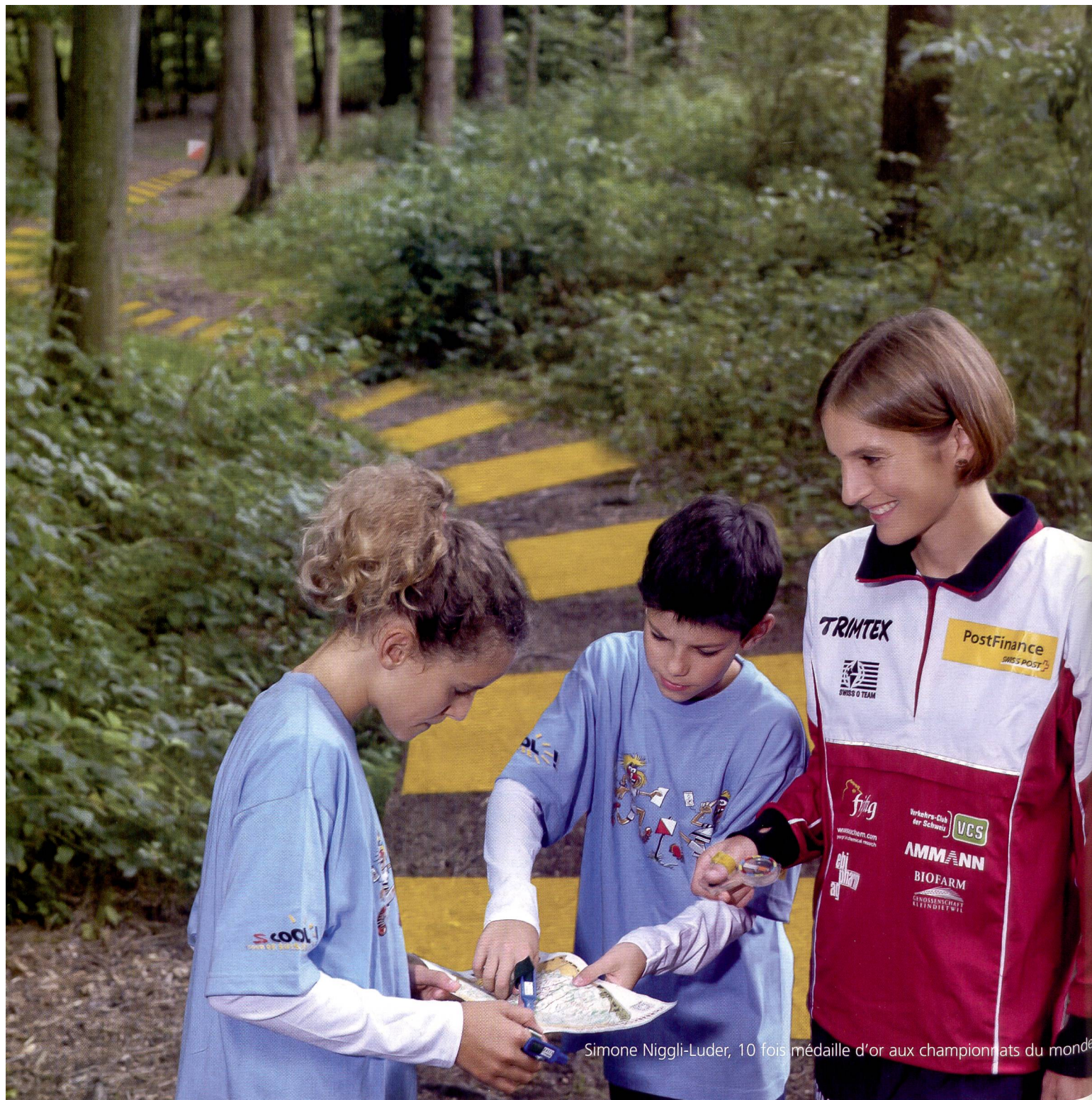
Simone Niggli-Luder, 10 fois médaille d'or aux championnats du monde