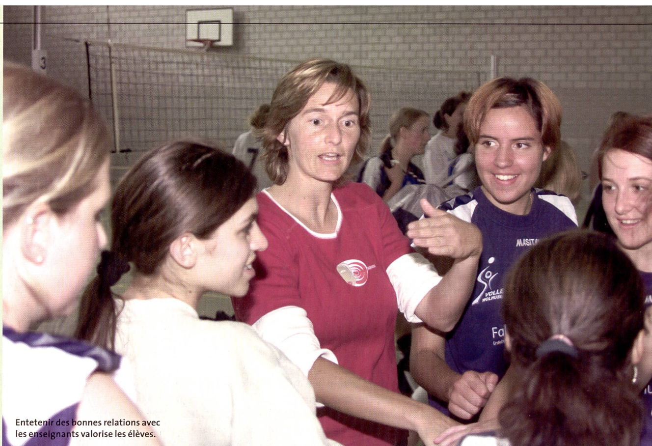
Entretenir des bonnes relations avec les enseignants valorise les élèves.