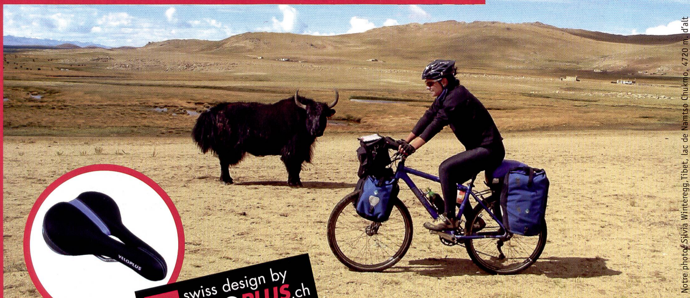
Notre photo: Silvia Winteregg, Tibet, lac de Namtso Chukmo, 4720 m, d'alt