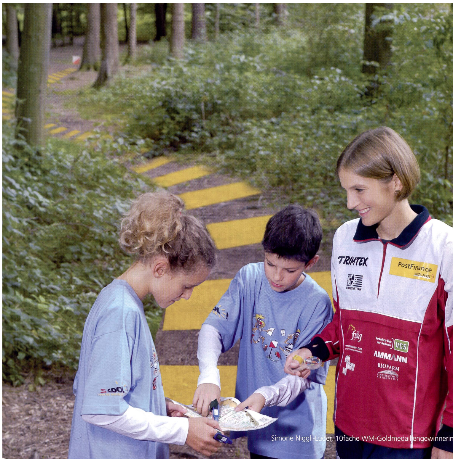
Simone Niggli-Luder, 10fache WM-Goldmedaillengewinnerin