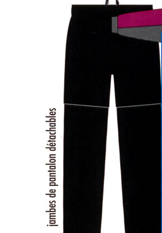
jambes de pantalon détachables