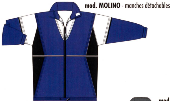
mod. MOLINO - manches détachables

Marka Sport réalise vos vœux de survêtements individuels et uniques à l'image de votre association.