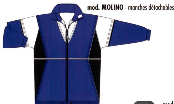
mod. MOLINO - manches détachables

Marka Sport réalise vos vœux de survêtements individuels et uniques à l'image de votre association.