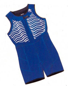
Wet Vest Body Fr. 369.-