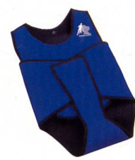
Wet Vest II Fr. 279.-