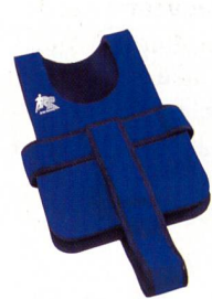
Wet Vest EC Fr. 179.-