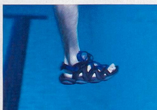
Pied en flexion durant le mouvement vers l'avant