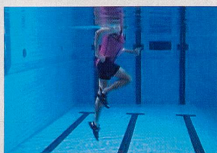
Soulever les genoux, avec flexion simultanée des pieds