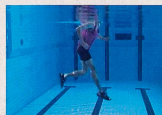
Phase de traction