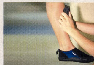
Expérimentation tactile de la résistance de l'eau