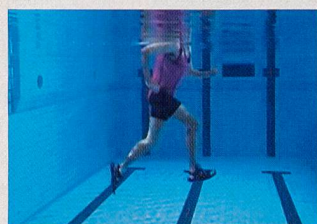
Avancer légèrement la partie inférieure de la jambe