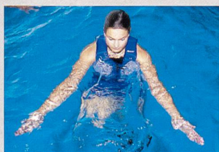
Exercices pour les muscles des groupes musculaires les plus faibles