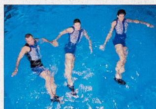
Gymnastique pour le tronc en position allongée