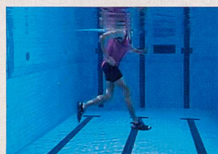
Extension du pied