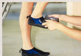
Acquérir la forme du pas hors de l'eau