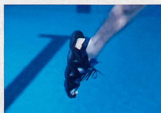
Tendre la cheville durant la phase de traction