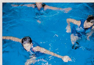
Exercices pour la ceinture scapulaire