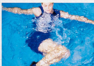
Renforcement de la musculature abdominale, mobilisation de la colonne vertébrale