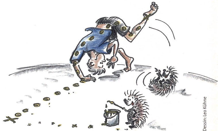
Dessin: Leo Kühne