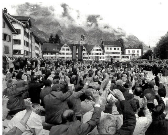
Les délégués ne manqueront pas d'assister à la traditionnelle «Landsgemeinde» qui suivra leurs débats matinaux.

Le dimanche matin, l'assemblée des délégués sera suivie, comme à l'accoutumée, de la «Landsgemeinde», qui se tiendra à Glaris. Les votes porteront sur trois thèmes importants, à savoir: la nouvelle loi sur la formation, les subventions cantonales pour le centre sportif de Glarner Unterland et la route de délestage qui mène de Näfels à Glaris. Les débats s'annoncent passionnés, mais ne manqueront pas de déboucher, comme à l'assemblée des délégués de l'ASEP, sur des décisions traitées en toute démocratie. m