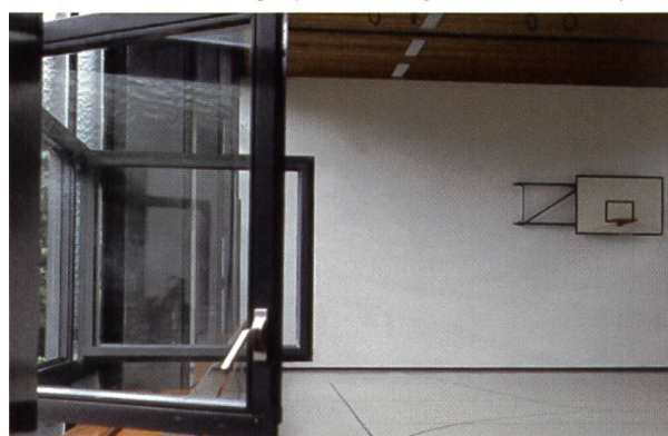
Une fenêtre ouverte... l'accident garanti.