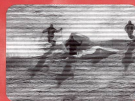
Swiss Telemark. The spirit of skiing Fr. 24.80