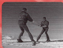
La conduite fonctionnelle en ski alpin Fr. 36.60