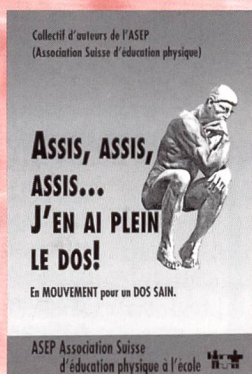
Assis, assis, assis... J'en ai plein le dos Fr. 23.-/28.-