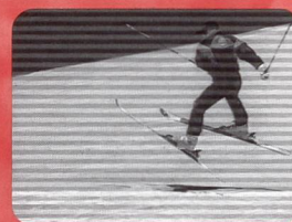
Du ski alpin aux sports de neige Fr. 25.90