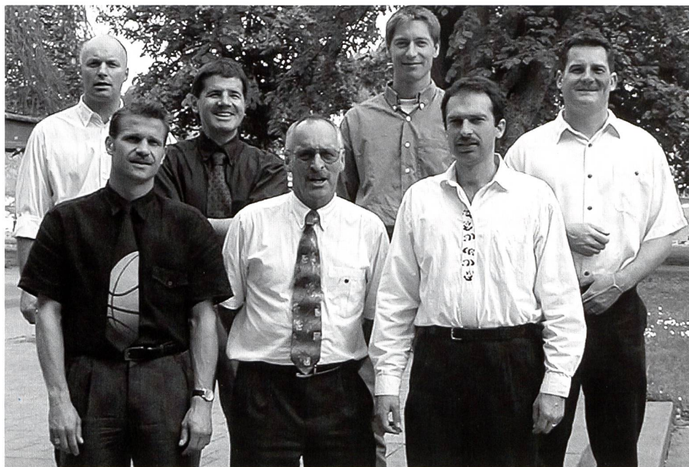
Pour le nouveau comité, une ère s'ouvre en matière de promotion de l'éducation physique à l'école qui nécessitera un engagement important.

soin, nous passer de base légale. Mais, comme c'est loin d'être une entreprise facile, il est essentiel que le sport reste jusqu'à un certain point une tâche de l'Etat. A long terme, j'aimerais bien réduire le temps et l'énergie que nous consacrons à discuter de la quantité au profit d'un débat sur la qualité. Le paysage de la formation est en train de changer du tout au tout et le sport scolaire n'échappe pas à cette profonde mutation. m