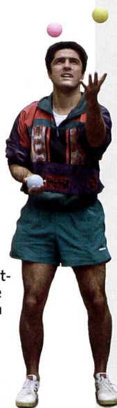
Le jonglage est-il une habileté clé? Réponse à la page 16!