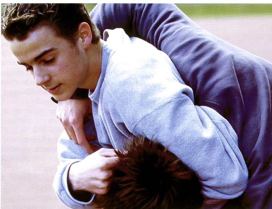
Thématiser l'agressivité pour apprendre à la gérer.

performances de ses élèves. La norme de référence individuelle mérite assurément la préférence sous l'angle de la promotion de la santé. Il faut également prendre en compte les effets spécifiques de l'enseignement coéducatif (on assiste souvent à un encouragement unilatéral des garçons dominants). Comme les expériences et les études le montrent, un effort moyen est optimal pour provoquer des effets positifs sur les performances scolaires.»