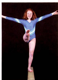
Avant-première du prochain numéro de «mobile»

Biokosma propose des offres intéressantes aux membres du mobileclub.