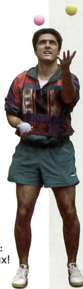
Jongler avec les trois leçons d'EP: un jeu dangereux!