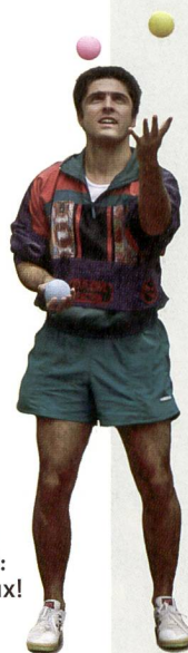
Jongler avec les trois leçons d'EP: un jeu dangereux!