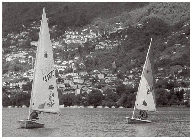
La voile est un sport particulièrement prisé.