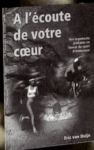
A l'écoute de votre cœur (1997) Fr. 19.80/17.80