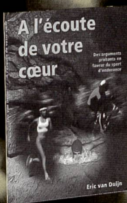
A l'écoute de votre cœur (1997) Fr. 19.80/17.80