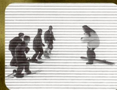
Cinq choisis parmi 100 000... ou: qui sont les monitrices/moniteurs Jeunesse + Sport? (1997) Fr. 32.40