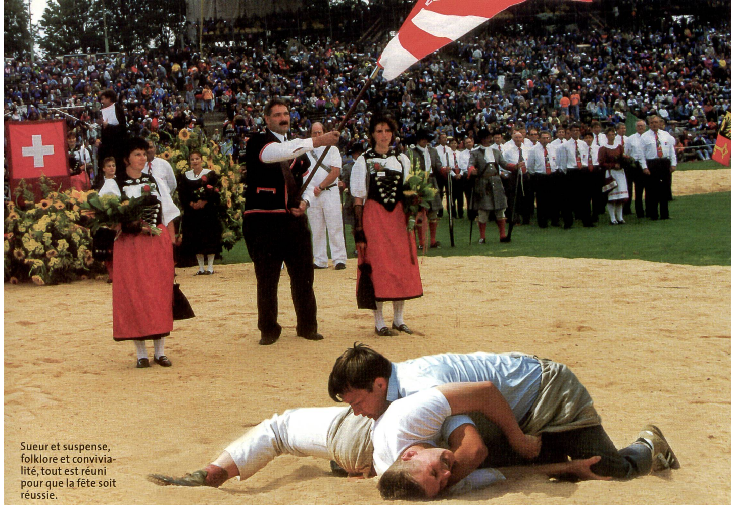
Sueur et suspense, folklore et convivialité, tout est réuni pour que la fête soit réussie.