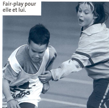
Fair-play pour elle et lui.