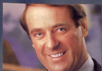
Adolf Ogi, conseiller fédéral

L'éducation vise le développement de l'être humain dans sa globalité. Le sport – dans le cadre de l'école ou en dehors de celle-ci – doit y contribuer.