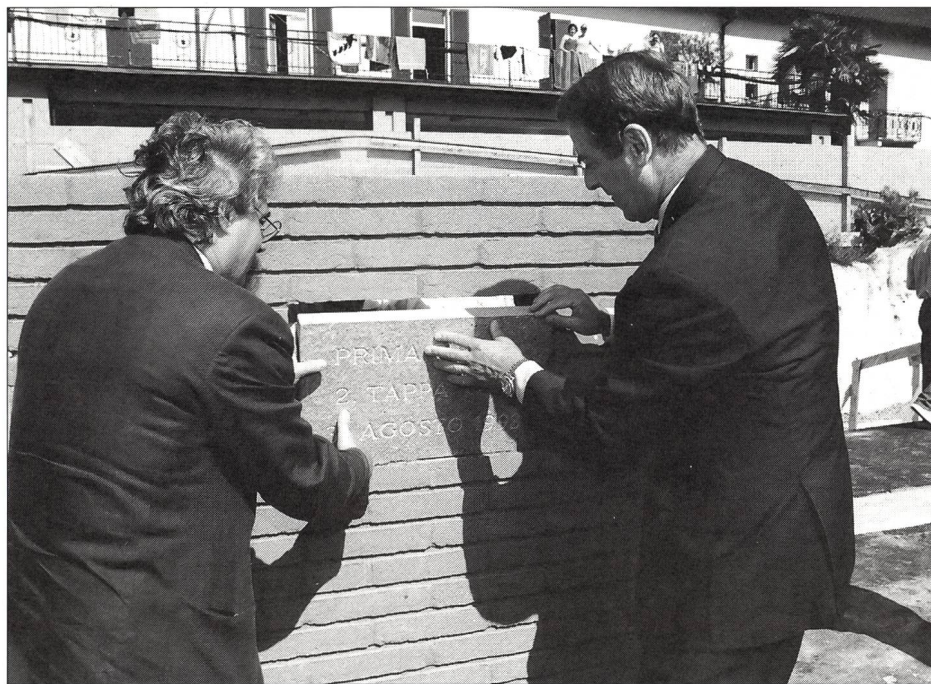
Le conseiller fédéral Adolf Ogi et l'architecte Mario Botta posent ensemble la première pierre.

Le «Centro sportivo nazionale della gioventù Tenero (CST)» a besoin d'un nouveau bâtiment de logement afin de mieux pouvoir exploiter ses installations, et ce – surtout – également en hiver. Il faudra attendre l'an 2001 pour voir ce projet réalisé.