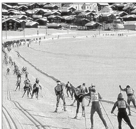
Région de la vallée de Conches: compétitions de ski de fond.

Les Jeux olympiques comportent toujours un important volet culturel, qui comprend notamment des représentations théâtrales, des expositions et des concerts. Le Valais, canton bilingue formé