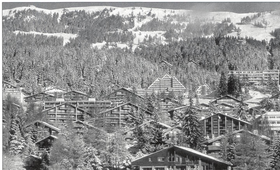
Région de Montana-Crans: compétitions de ski alpin.