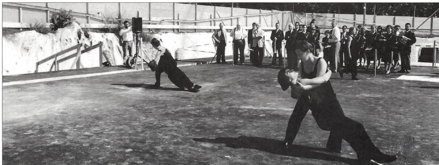
Sur les fondements du nouveau bâtiment (situé près de l'ancien bâtiment), un groupe de danseurs tessinois présente, de manière artistique, le thème «Travailler sur un chantier».