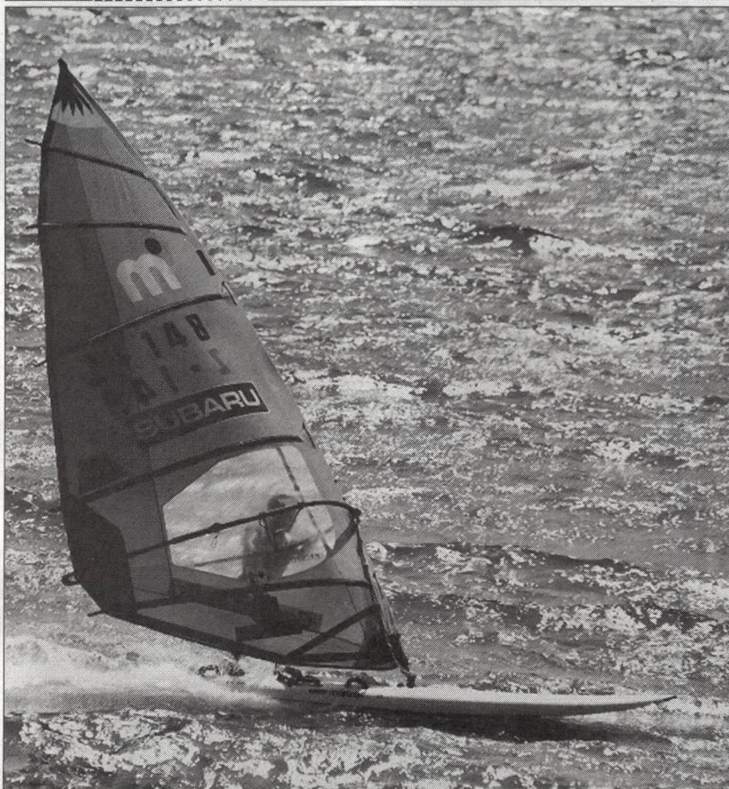
Revue mensuelle de l'EFSM et de Jeunesse+Sport

ment, au nom de la rédaction, tous ceux qui ont bien voulu remplir et renvoyer le questionnaire. ■