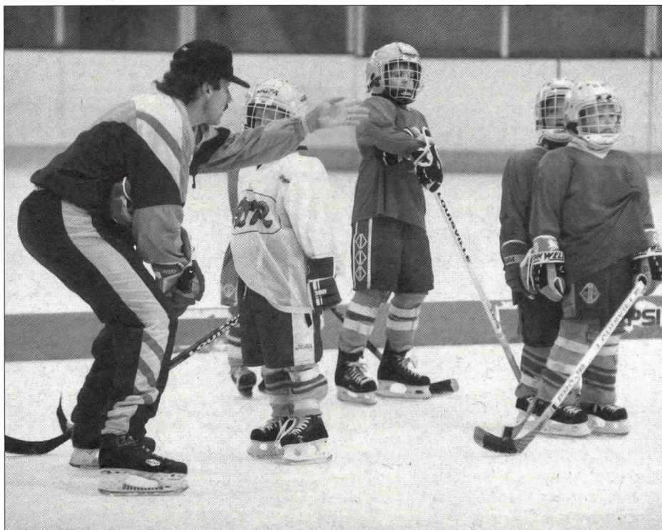
Nous devons agir: la direction reste à définir...