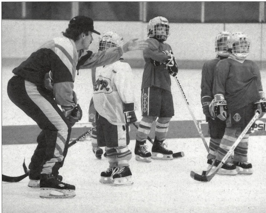
Nous devons agir: la direction reste à définir...