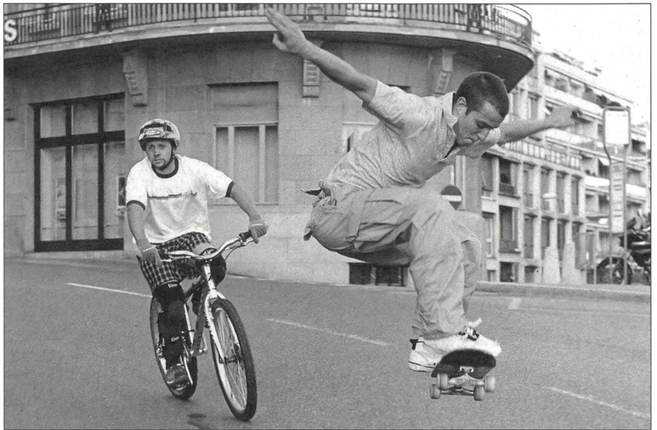
C'est du milieu du «jeune adulte» que jaillissent la plupart des sports à la mode.

Les tendances (mises en scène) sportives se distinguent, en ce qui concerne l'appréciation des valeurs et la conception de la vie, par des signes (codes) symboliques, d'essence culturelle, en rapport