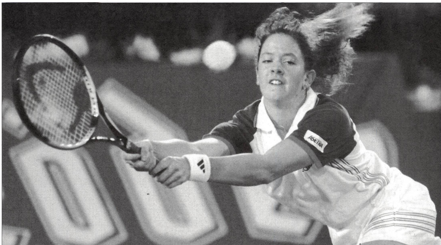
Patty Schnyder, un talent qui a fait son chemin jusqu'à l'élite mondiale.