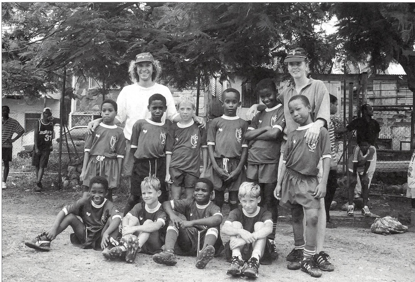
Les jeunes de la «Junior football school» et des petits vacanciers suisses lors d'un tournoi de football à Roseau.