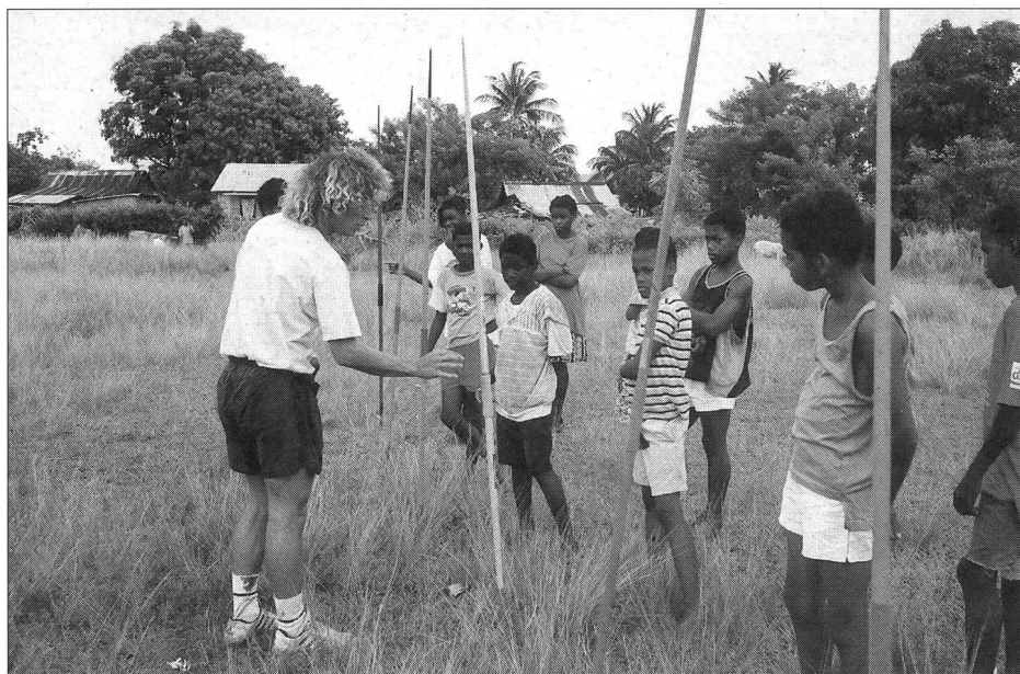
Camp d'été «Basic athletics».