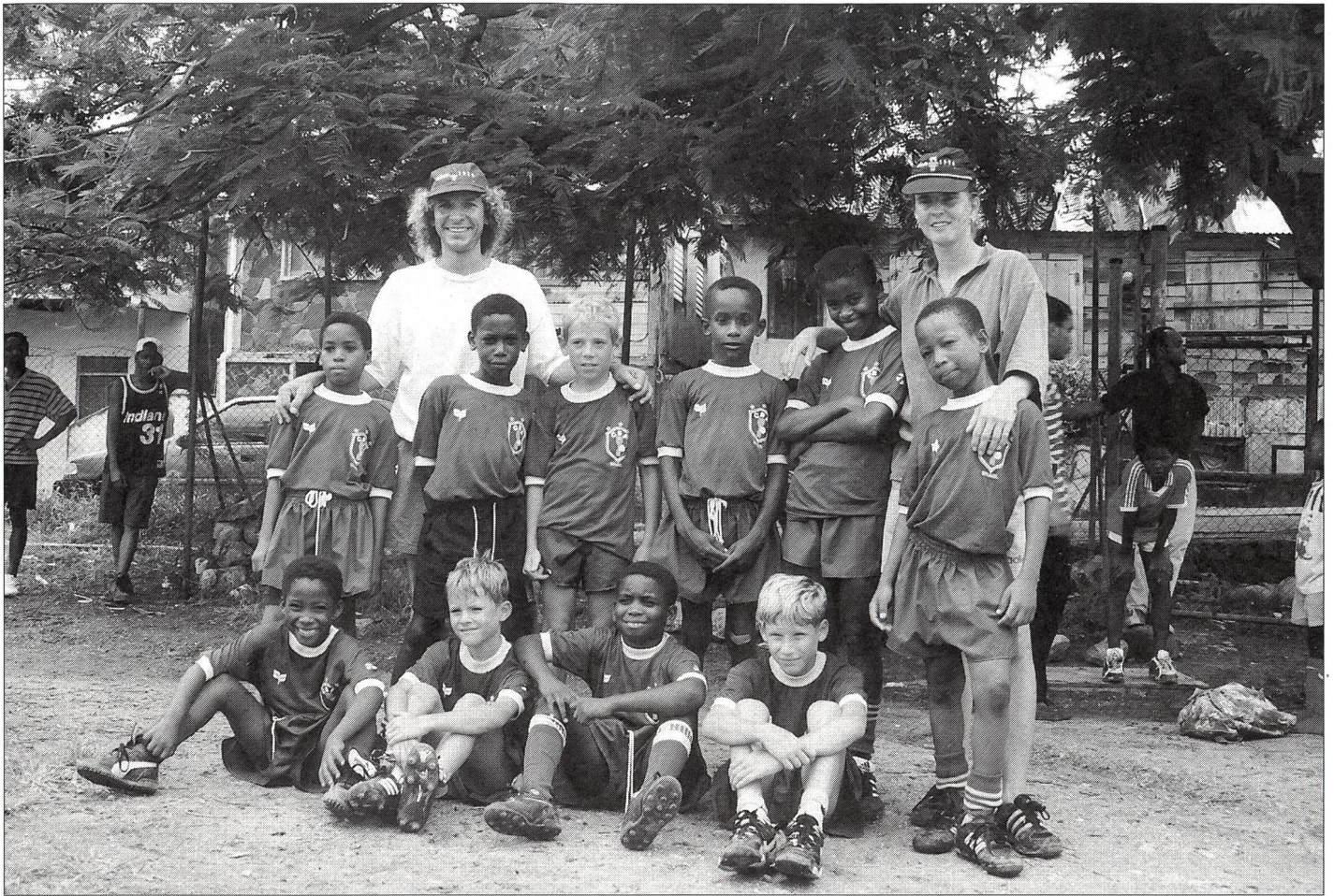
Les jeunes de la «Junior football school» et des petits vacanciers suisses lors d'un tournoi de football à Roseau.