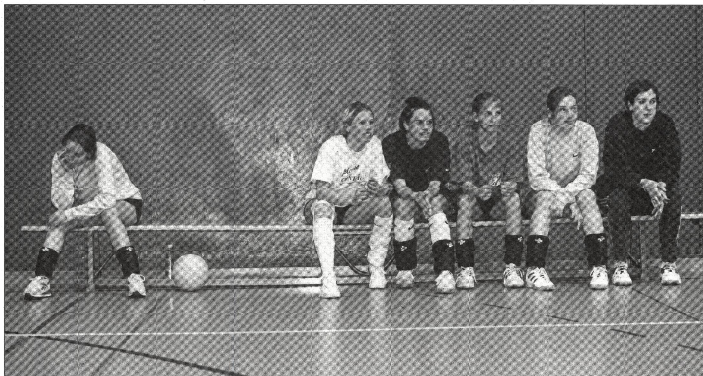
Joueuse remplacée assise sur le banc. Déçue, frustrée, seule. Une scène que l'on voit dans tous les sports d'équipe.

Gordon, Th.: Comment apprendre l'autodiscipline aux enfants. Eduquer sans punir. Ed. le jour, Québec 1990. ■