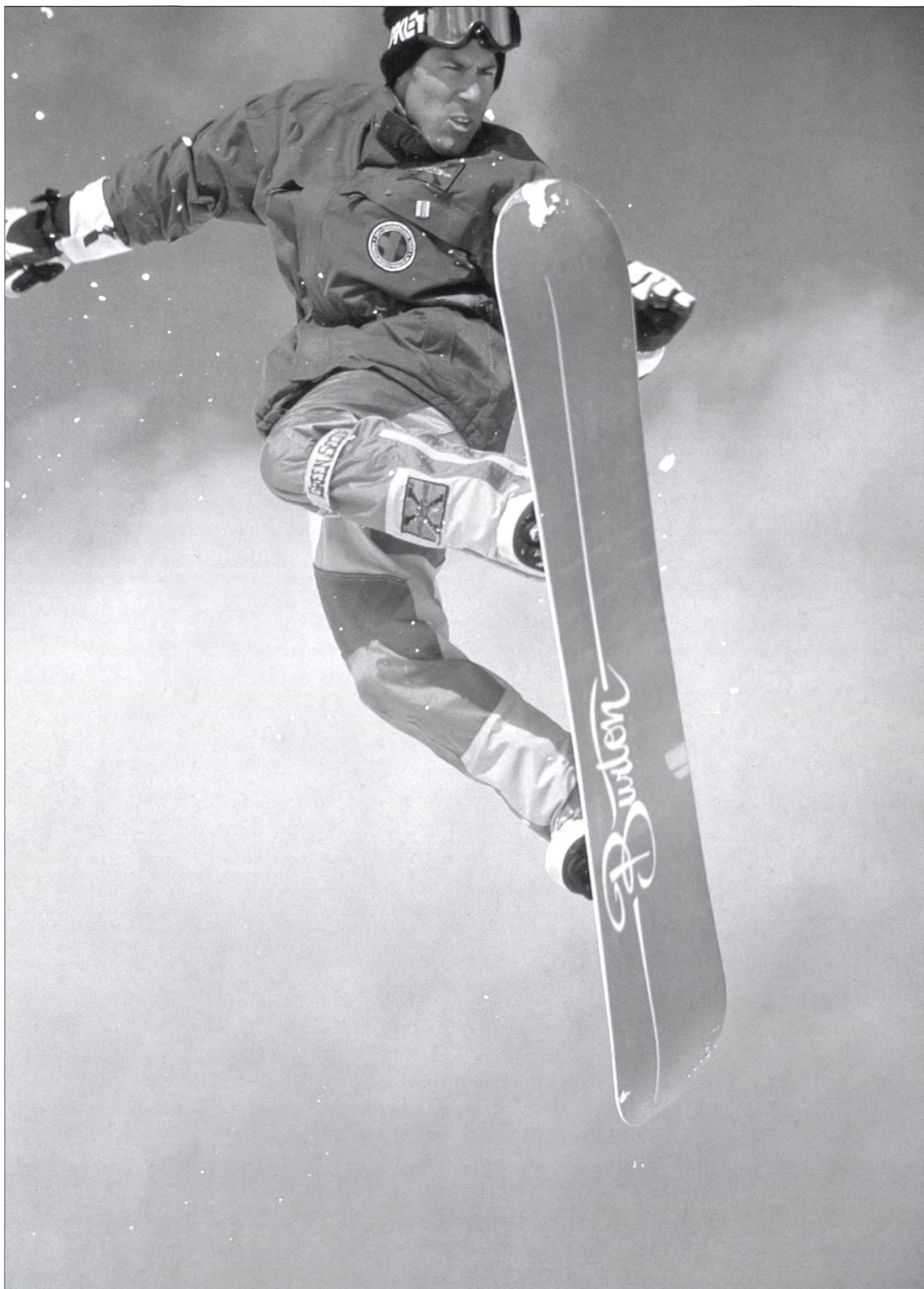
Le snowboard, un sport qui demande beaucoup de souplesse.