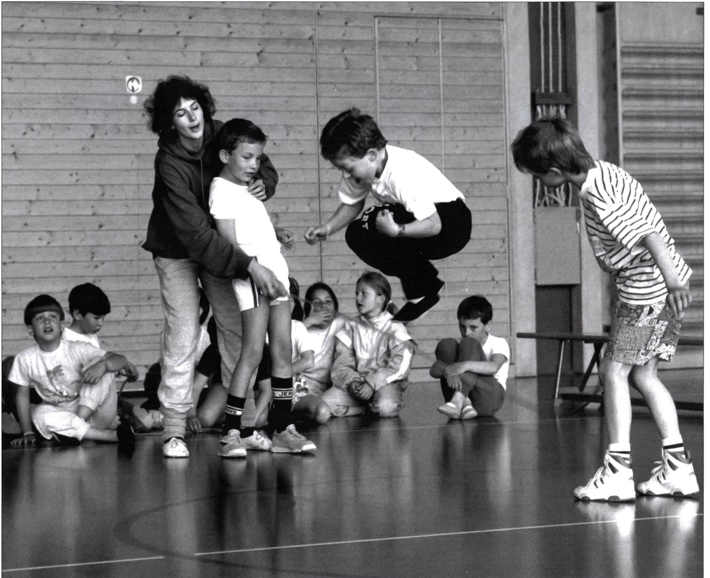
L'art de créer une bonne ambiance d'enseignement.