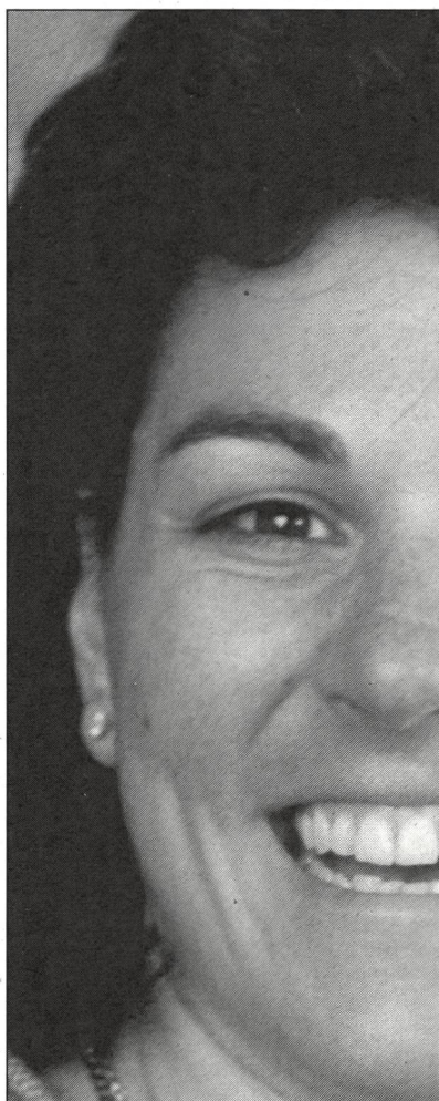
Le regard, reflet de la personnalité.