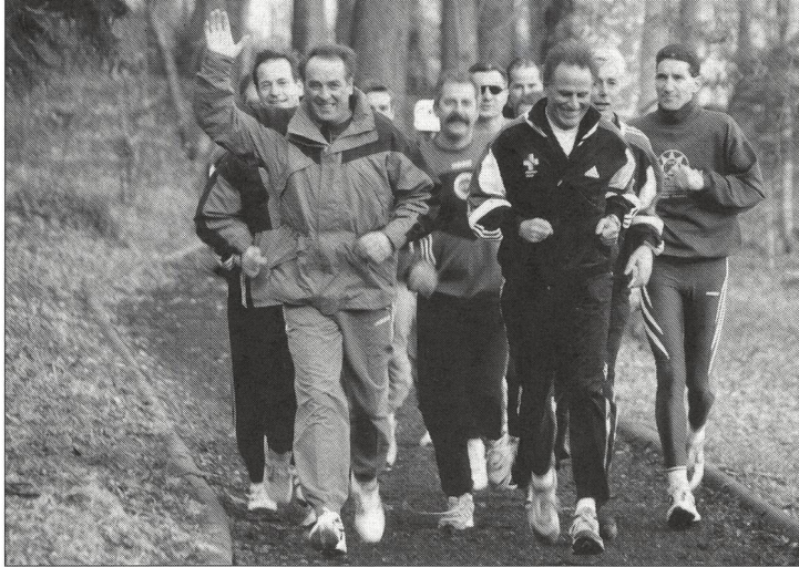
Lors de sa visite à l'EFSM, Adolf Ogi, nouveau Ministre des sports, a donné le tempo.