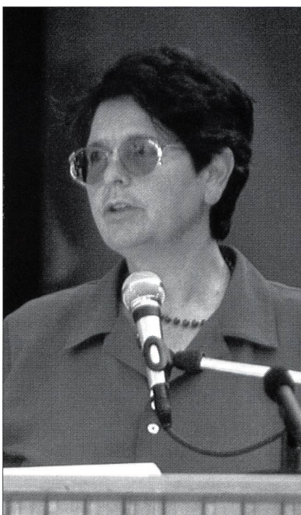
Ruth Dreifuss, ministre du sport, prend congé d'un public qui lui tient à cœur: les jeunes!

de motivation personnelle et de richesse de la relève; c'est également un problème de sélection et de formation. En fin de compte, c'est un problème qui dépend de la valeur qui est accordée, dans notre société, au sport.