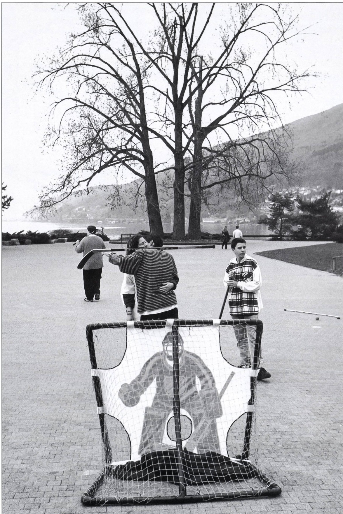
Lac de Bienne. Printemps 1997.