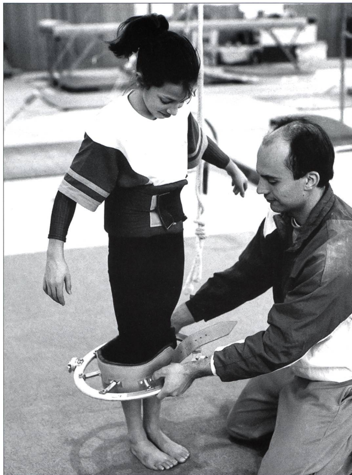
Un accessoire pour éviter de prendre des risques inutiles...