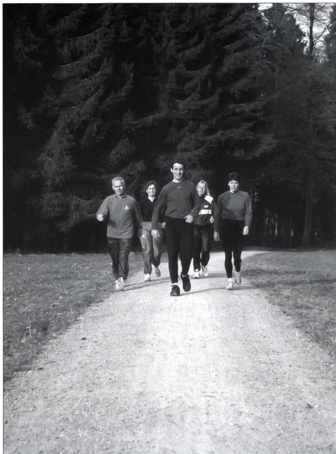
Le walking, c'est encore mieux que la marche sportive!