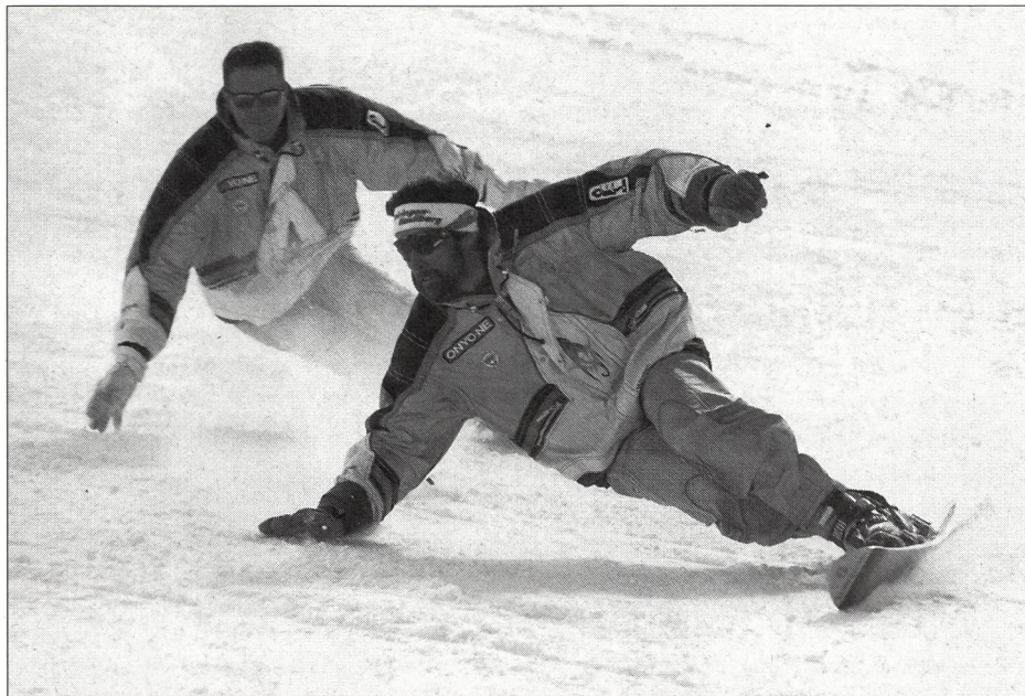
Le skwal, un terme synonyme de «sport de neige».

L'automne passé, un groupe composé d'une équipe de démonstration, de maîtresses et de maîtres de classe, d'experts issus de l'Interassociation ainsi que des promoteurs du «Projet de manuel pour l'enseignement des sports de neige en Suisse» (PULS en allemand) s'est réuni à Zermatt. Son but: permettre aux participants de se familiariser, aussi bien sur les pistes qu'autour d'un bon feu de cheminée, avec les idées directrices du futur manuel didactique, actuellement en cours d'élaboration.