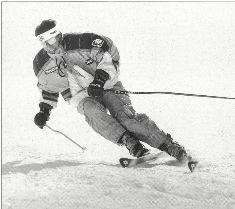
Vreni Schneider, experte dans l'art de la glisse, du jeu avec les carres et du virage.