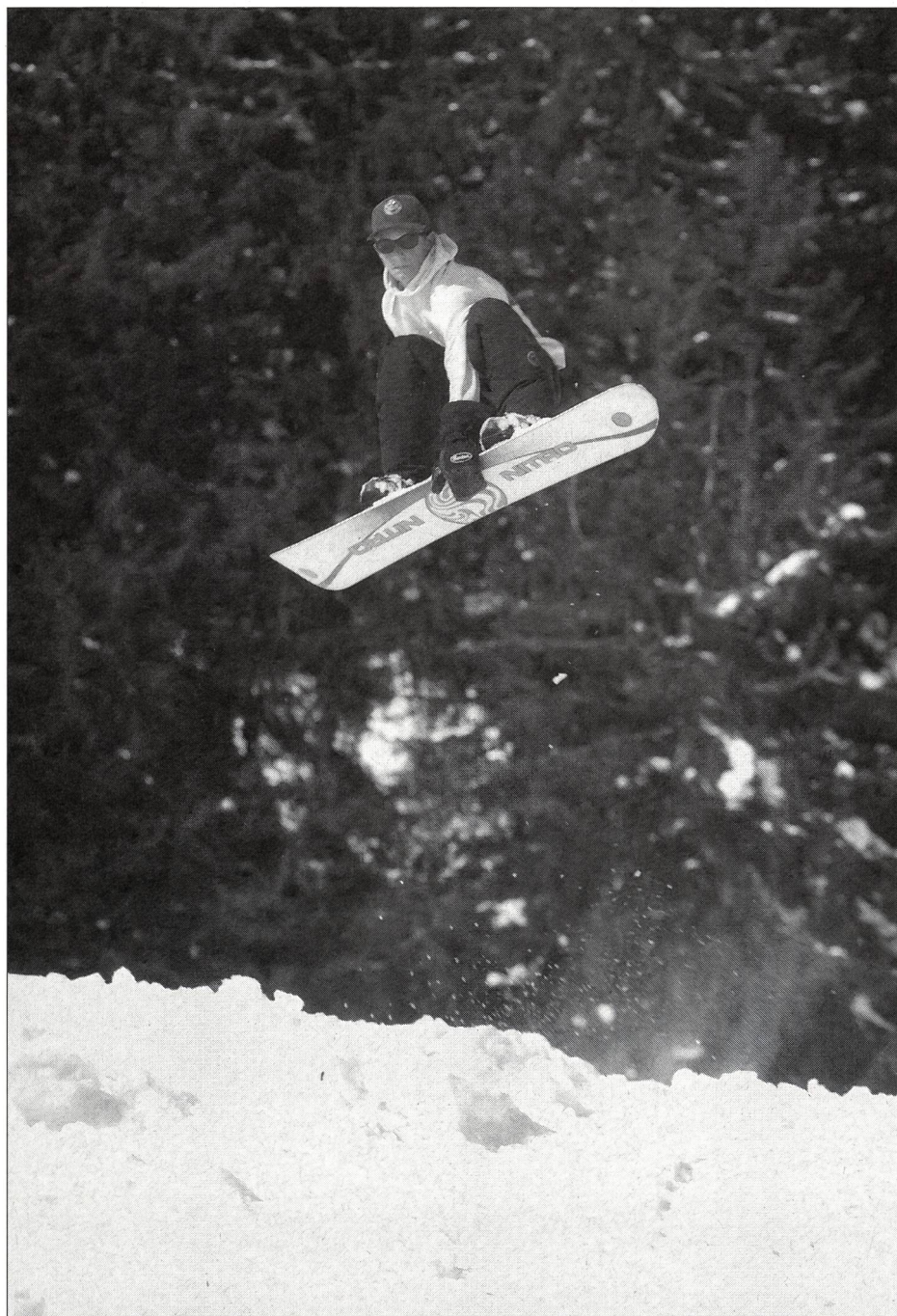
Le modèle cinétique «prendre son appel» peut conduire au saut.

De l'acquisition des compétences à la gestion de celles-ci, tout le processus d'apprentissage vise à acquérir une parfaite maîtrise de soi, maîtrise qui, combinée avec des habiletés correspondantes, permet de gérer le (dés)équilibre dans des situations de sports de neige dynamiques et dans le cadre des limites propres à chacun. ■