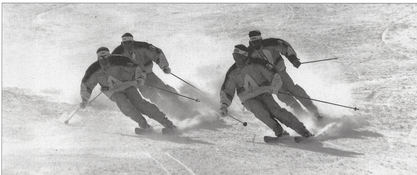
Le Swiss Snow Demo Team, nos ambassadeurs du ski «carving».