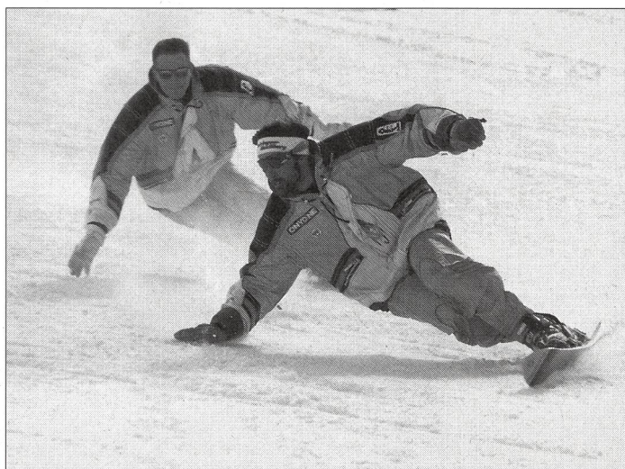
Le skwal est aussi un engin «carving» fascinant!