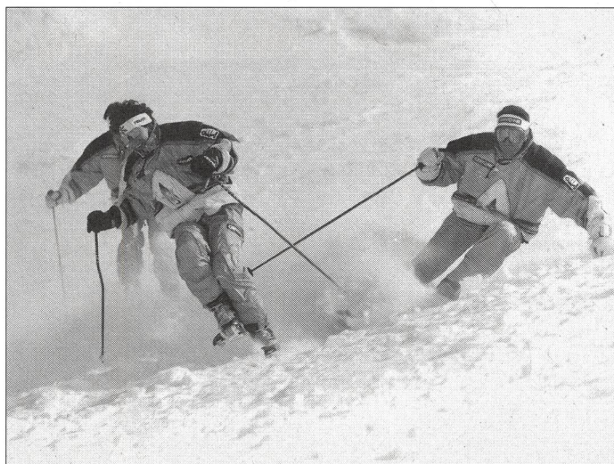
Neige poudreuse et ski «carving»: plaisir assuré!