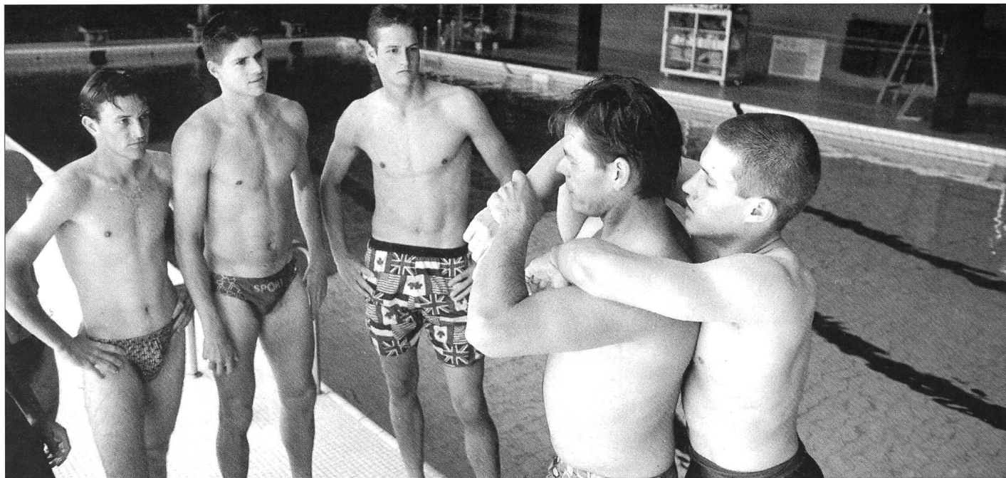
A la piscine de l'EFSM, les recrues reçoivent une formation de sauveteur.

Du 2 septembre au 11 octobre dernier, l'EFSM accueillait pour la dixième fois le cours technique de sport de l'Office fédéral des armes de combat (OFARC). Plus de 600 recrues ont déjà reçu la formation de «chef de sport 1», formation