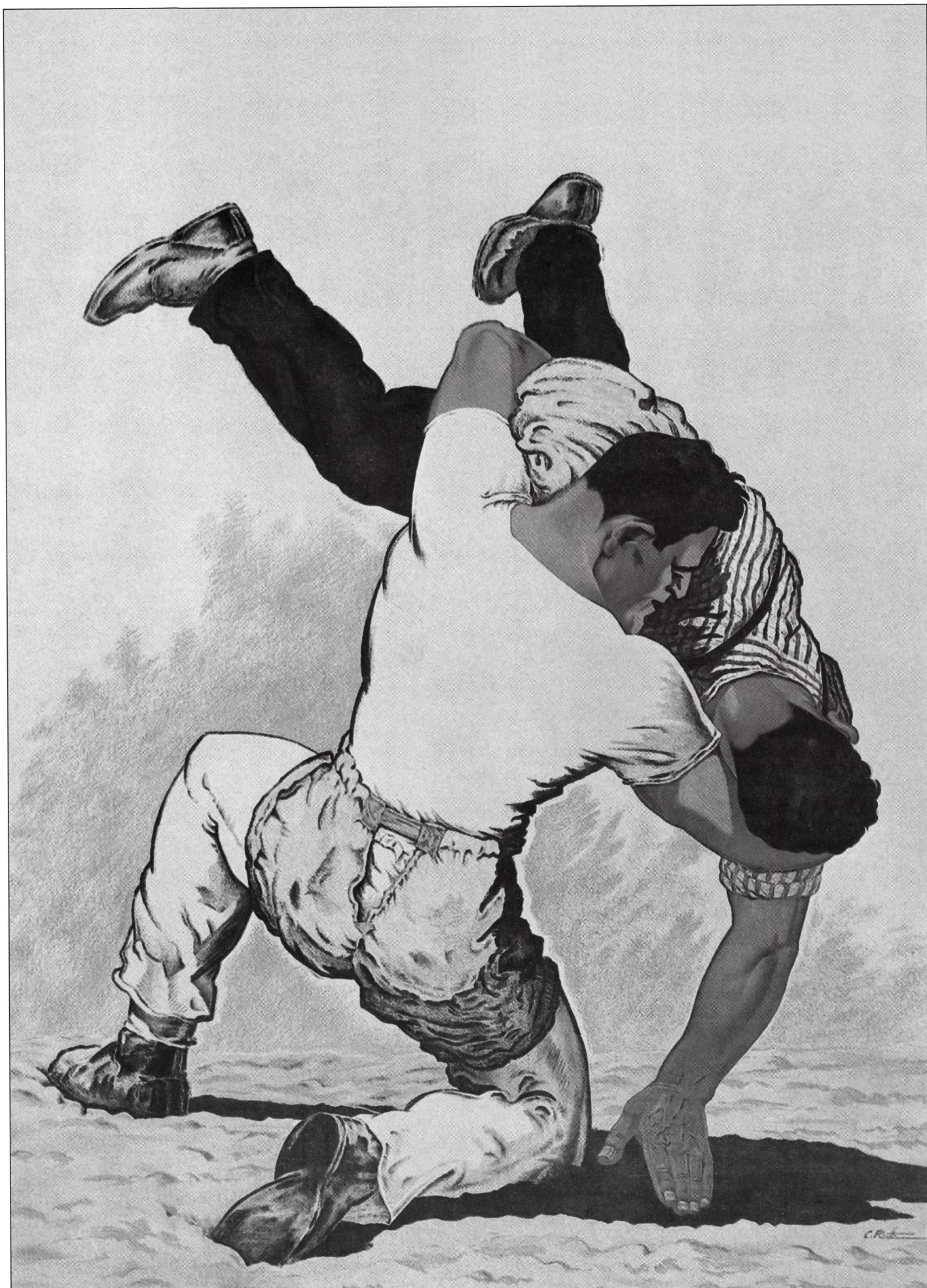
Le Musée suisse des sports expose à l'EFSM, jusqu'au 13 décembre 1996, «Les jeux nationaux et populaires de la Suisse».