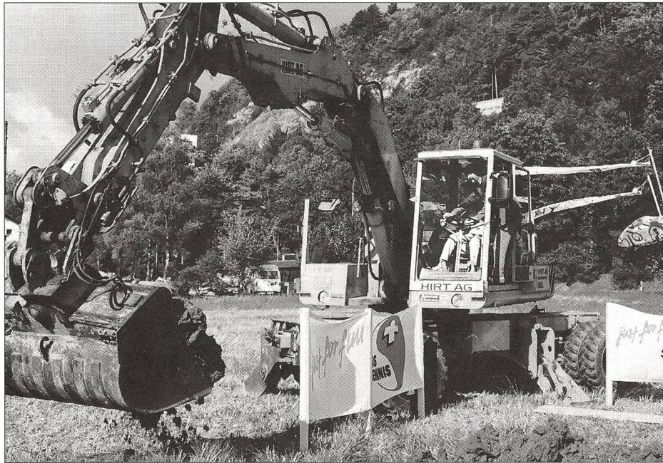
C'est parti! Le premier coup de pelle mécanique a été donné le 7 septembre 1996.

Frédy Léchat, section des installations sportives de l'EFSM