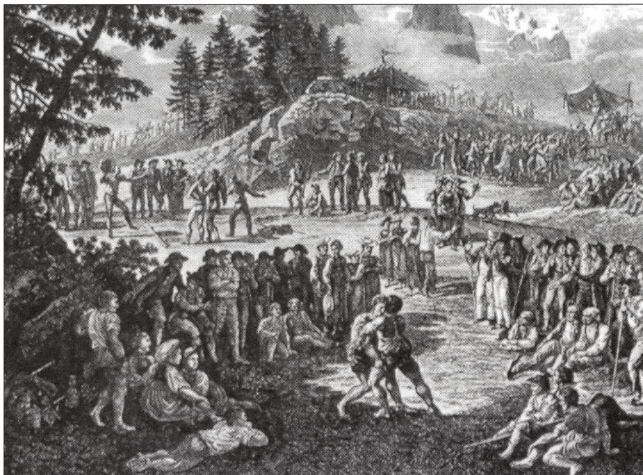
Bergers suisses fêtant sur l'alpage.

Du 12 septembre au 13 décembre 1996, le Musée suisse des sports, domicilié à Bâle, présente, dans le foyer de l'EFSM, une exposition intitulée Jeux nationaux et populaires de la Suisse .