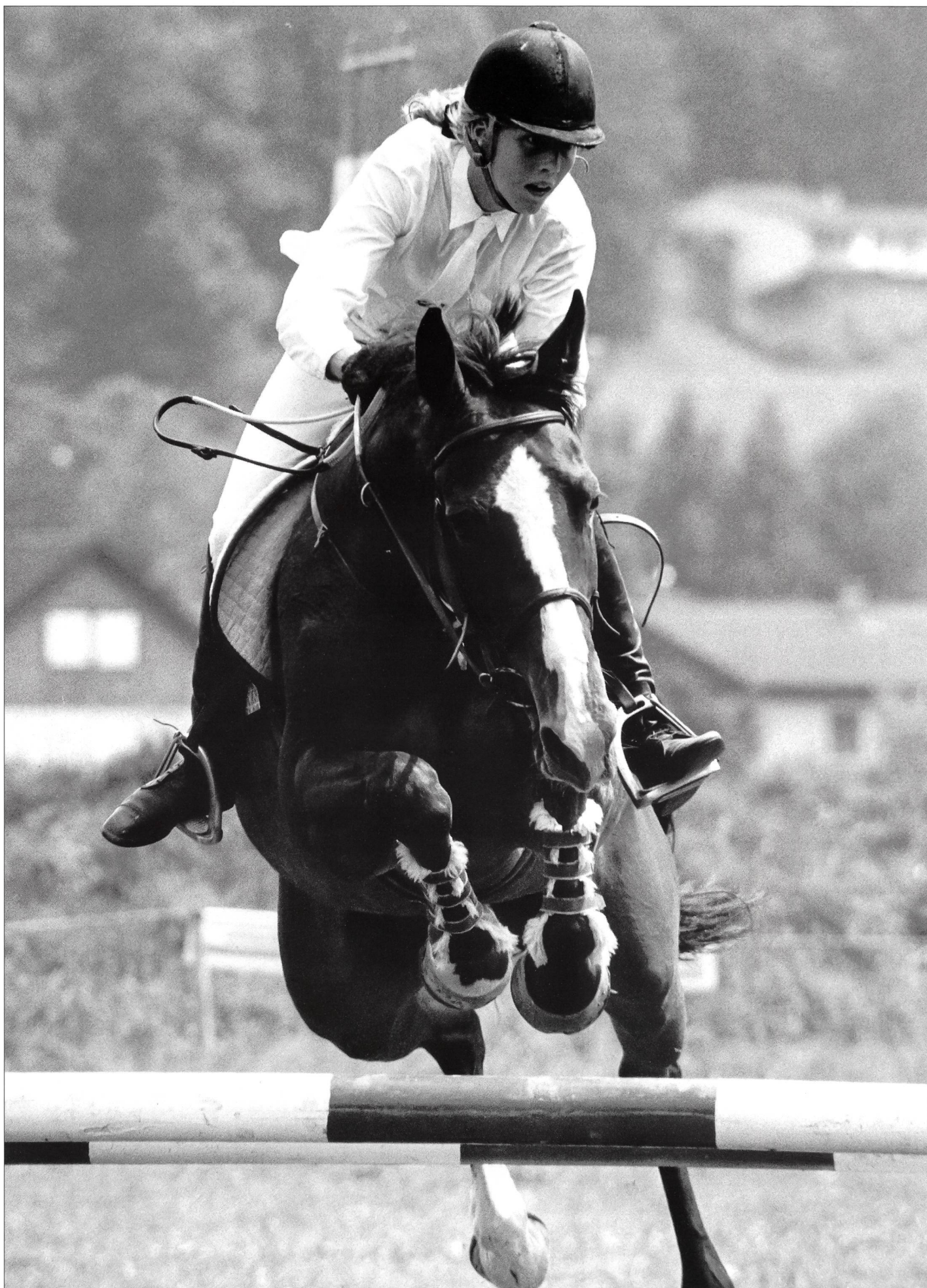
Les sports équestres, désormais au programme Jeunesse + Sport.